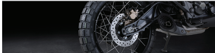
Ενισχυμένο ψαλίδι κράματος αλουμινίου Εξαιρετικής σχεδίασης εξάτμιση